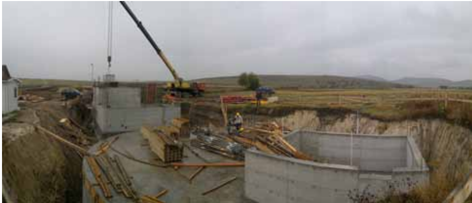
A víztisztító állomás építése Csíkmadaras határában

2. A Vízkezelő állomás bővítése és a szállítóvezeték kiépítése projektet az ING SERVICE – TERMOLANG – HID-